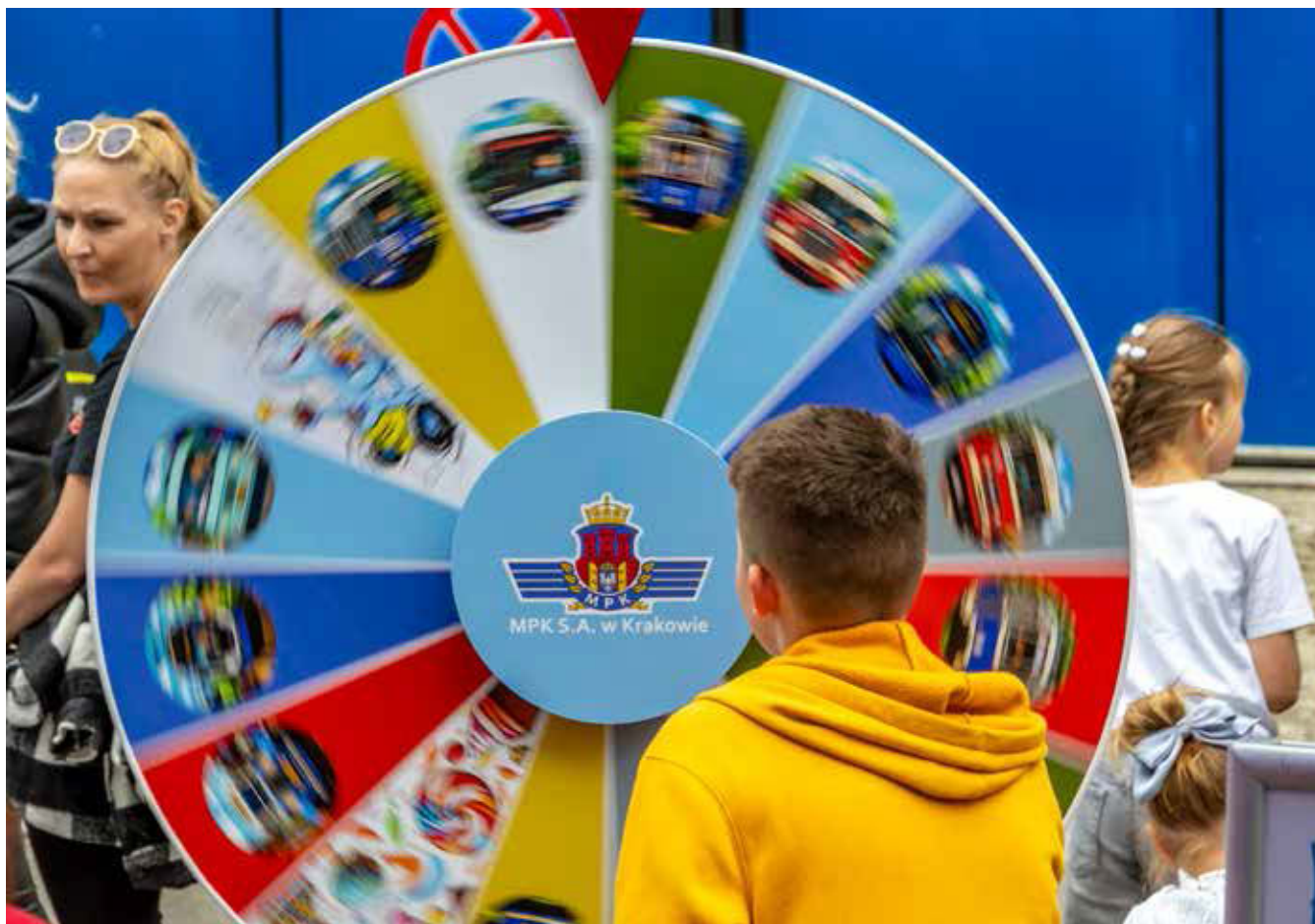
Koło fortuny – gwarancja dobrej zabawy i atrakcyjnych nagród

Dzieci otrzymały kolorowe baloniki, a niestrudzony w zabawie z najmłodszymi Trambuś rozdawał cukierki. Z wielką radością pozował z dziećmi do zdjęć.