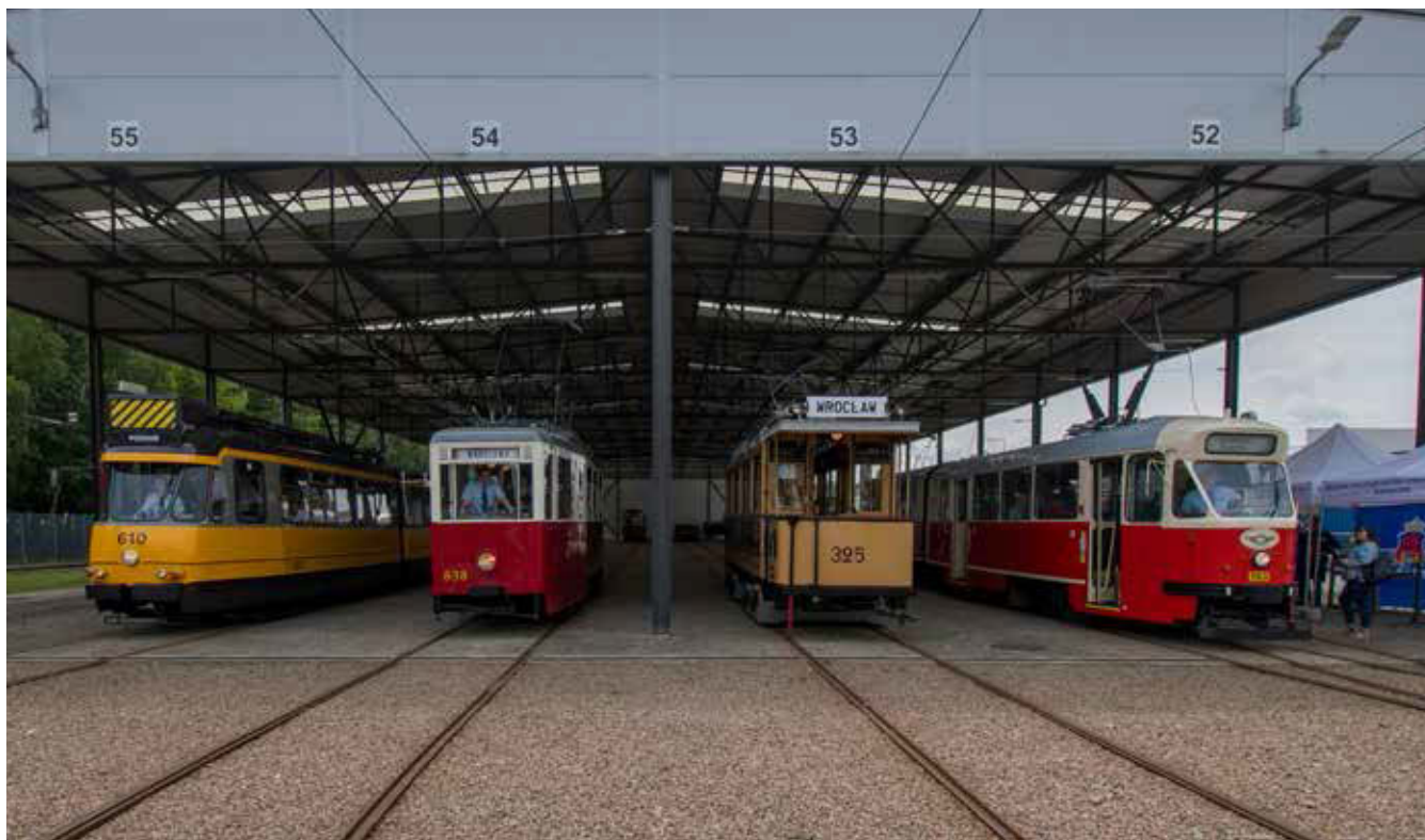
Wypożyczone wagony zostały reprezentowane w zajezdni tramwajowej Nowa Huta