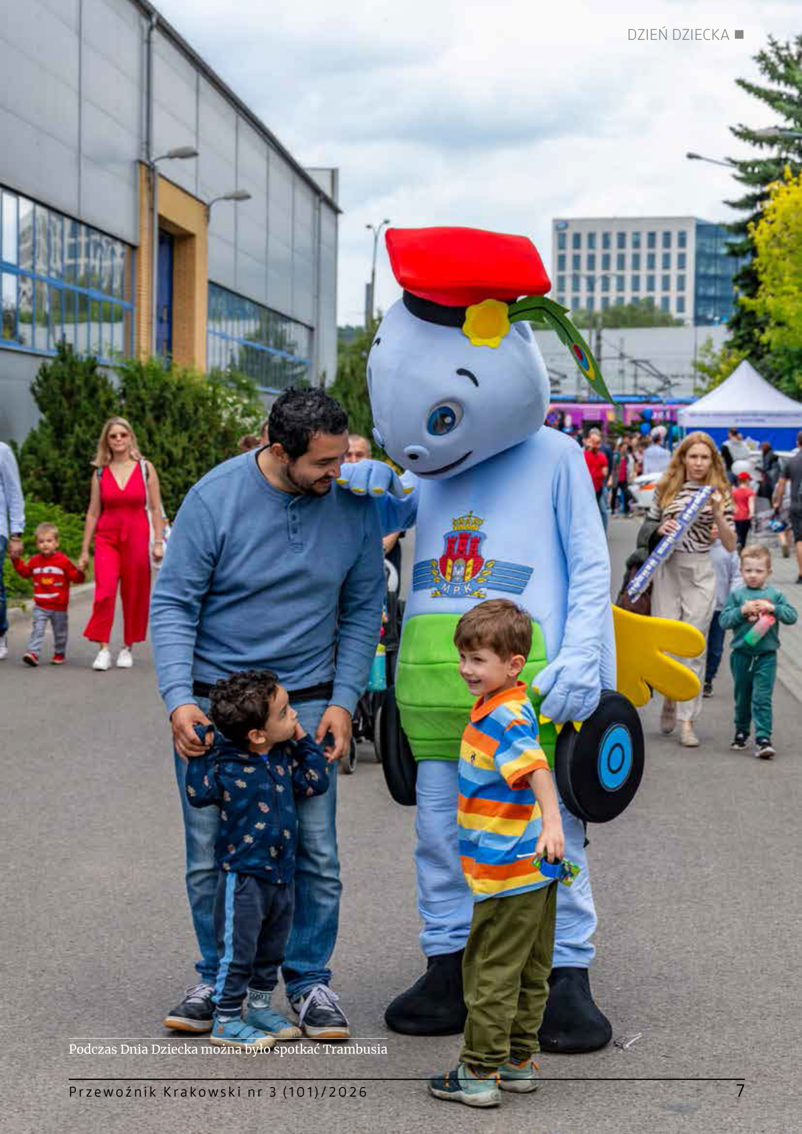
Podczas Dnia Dziecka można było spotkać Trambusia