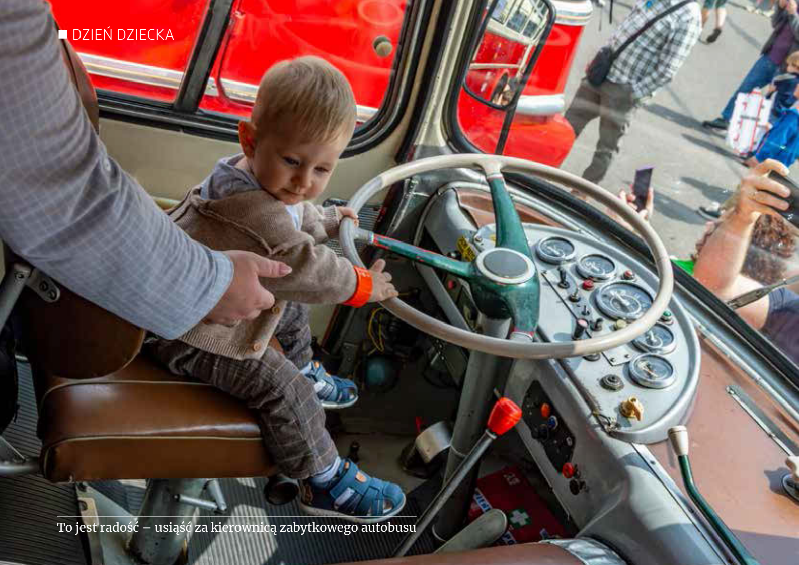
To jest radość – usiąść za kierownicą zabytkowego autobusu