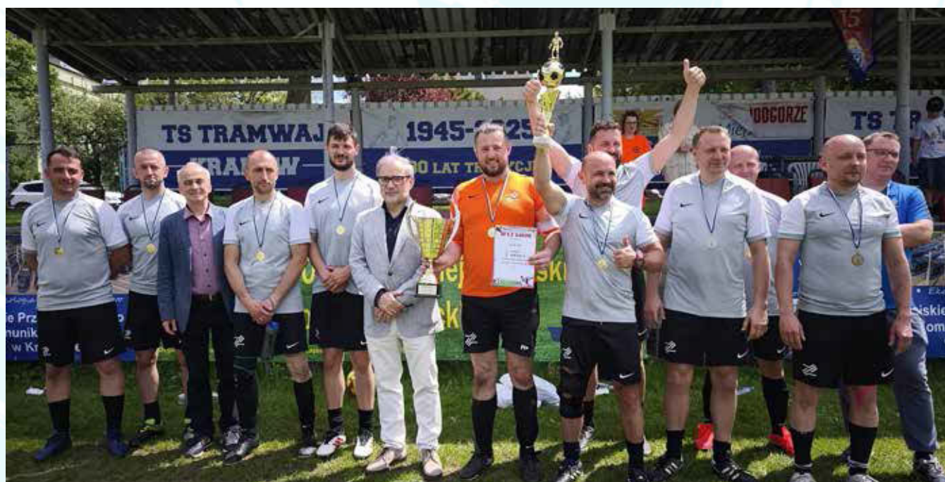
Drużyna ZUE z pucharem i medalami

W sobotę 23 maja, na boisku TS Tramwaj Kraków odbył się 17. Turniej im. Piotra Pruchnickiego. Zwyciężyła drużyna złożona z pracowników ZUE S.A., która w wielkim finale po rzutach karnych pokonała zespół Zajezdni Autobusowej Wola Duchacka. Trzecie miejsce wywalczyła ekipa Stacji Remontów, pokonując PKP PLK.