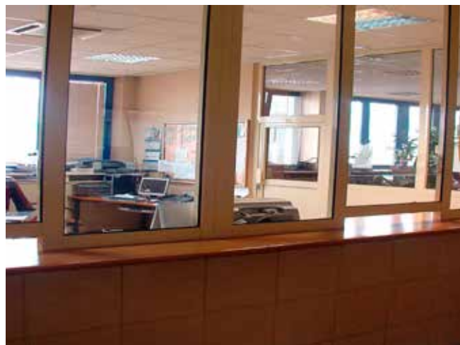
Tak dyspozytornia wyglądała przed remontem...

Gruntowny remont przeprowadzono w toaletach i łazienkach dla motorniczych znajdujących się w hali OC. W remontowanych pomieszczeniach poczekalni i toa-