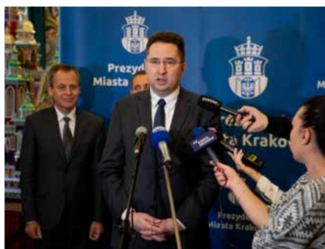
Informacje o podpisaniu umowy na dostawę tramwajów zostały przekazane podczas briefingu prasowego

- Bardzo się cieszymy, że podpisujemy dziś umowę na kolejne 15 tramwajów. Zamówienie dla Krakowa jest dla nas bardzo ważne. Jesteśmy dumni, że możemy je realizować. Jestem przekonany, że nasze nowoczesne, nisko-