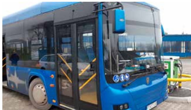
Elektryczny autobus firmy TROLIGA podczas ładowania w Stacji Obsługi Autobusów Wola Duchacka