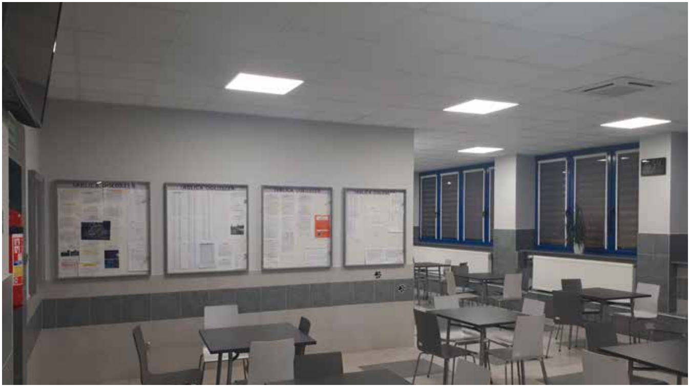
Po remoncie poprawił się komfort zarówno dla motorniczych...