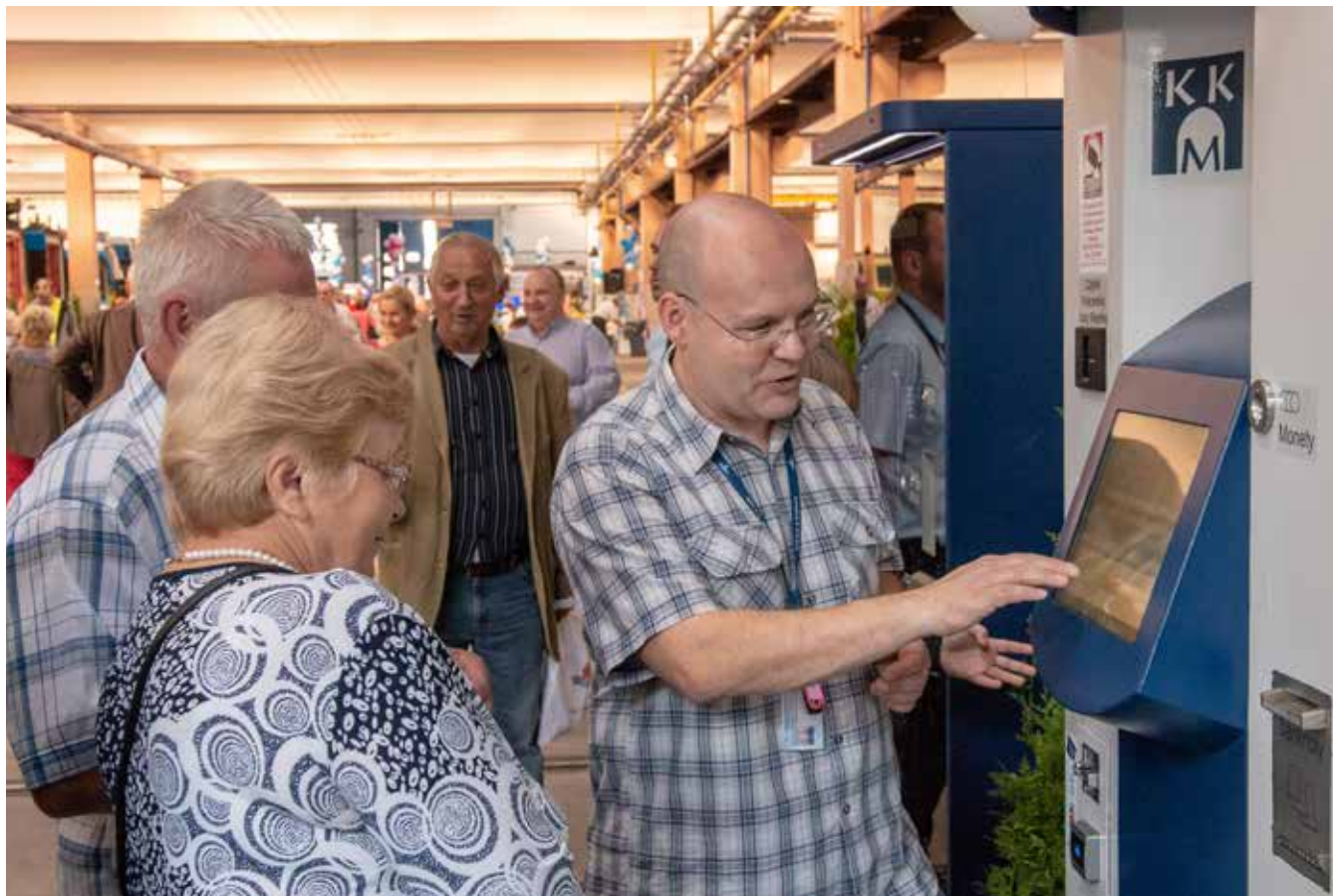
Zakup biletu w automacie wcale nie jest taki trudny