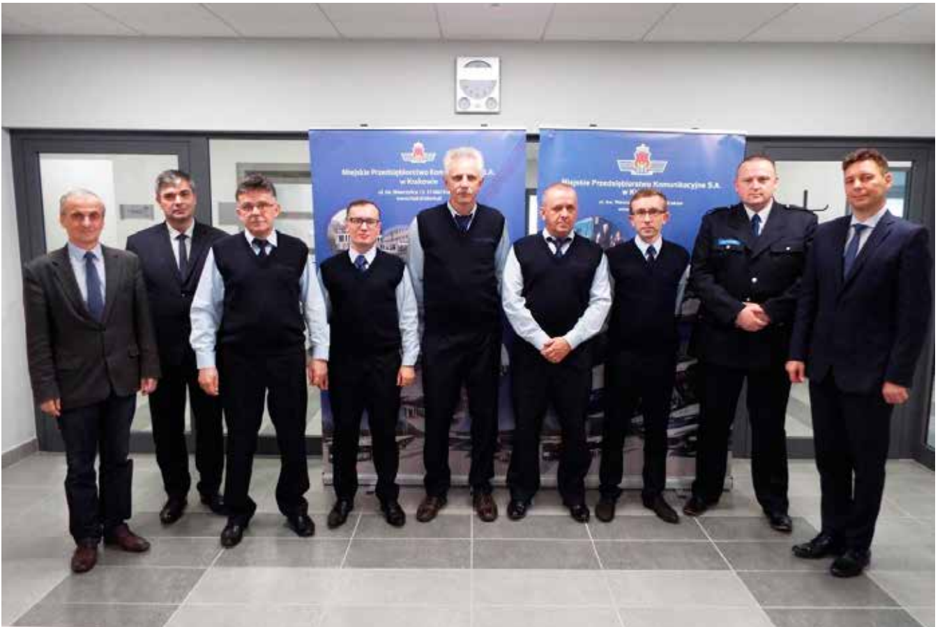
Nominowani do nagrody Lidera Jakości w 2018 roku