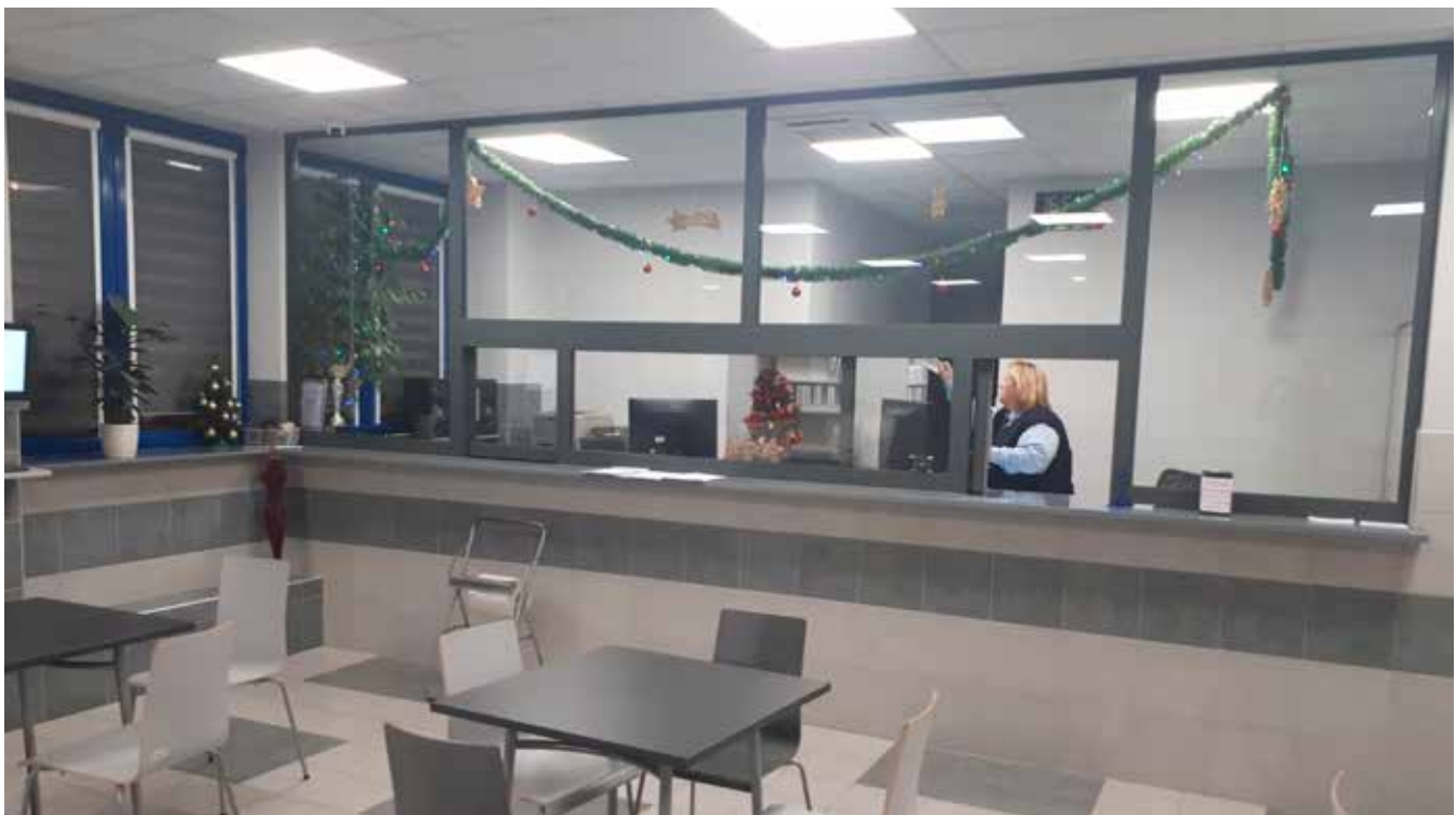
...jak i dla dyspozytorów zajezdniowych

no (w miejsce gumowej wykładziny) gres. Wymienione zostały również parapety.