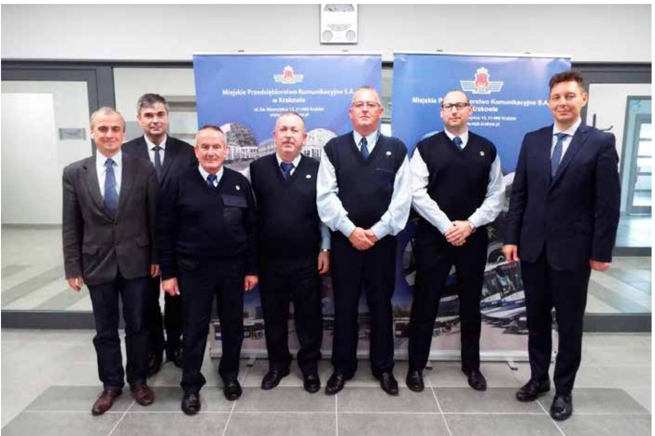
Liderzy Jakości 2018 MPK S.A. w Krakowie