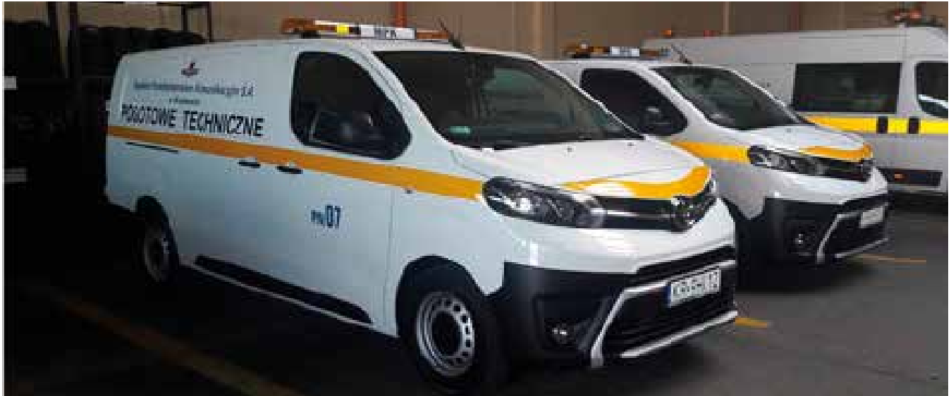
Nowe pojazdy pogotowia tramwajowego

P racownicy Technicznego Pogotowia Tramwajowego zyskali dwa nowoczesne i przyjazne dla środowiska pojazdy. Nowe samochody to Toyota Proace wersja Activ Long. To właśnie tymi pojazdami mechanicy pogotowia tramwajowego będą dojeżdżać do kursujących w Krakowie wagonów, aby m.in. naprawić zablokowany automat biletowy, wymienić żarówkę, wycieraczkę czy udzielić pomocy podczas zatrzymania. Nowe pojazdy są bardzo dobrze przystosowane do tego, aby w środku mogły się znaleźć wszystkie niezbędne narzędzia oraz części zamienne. W zabudowanej części warsztatowej została położona antypoślizgowa podłoga oraz nowoczesne i trwałe regały Boot Vario firmy Pronar z dużą ilością szuflad, przegród i pojemników. W środku zamontowano również dopasowane do potrzeb pogotowia oświetlenie typu Led.