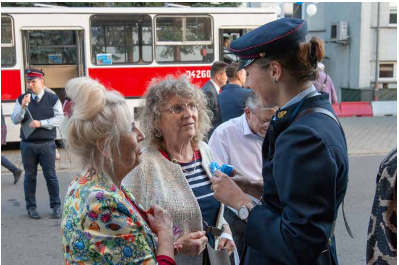
Każdy uczestnik miał przypinany okazjonalny kotylion